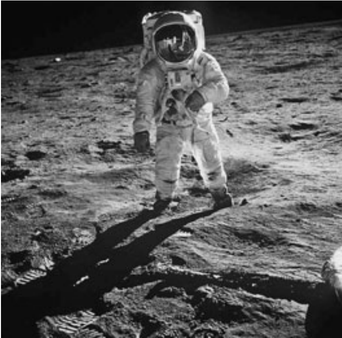
20. Juli 1969. »Buzz« Aldrin auf dem Mond. Ich war zehn und dabei.

fortschrieb, dass man selbst ein Teil dieser unablässigen Erweiterung des Machbarkeits- und Erwartungshorizontes wurde. Auch auf diese Weise wurde die expansive Kultur der Moderne Teil unserer mentalen Innenausstattung (bei den Mädchen sah es wahrscheinlich ein wenig anders aus, aber ein anderes Verhältnis zu Gegenwart und Zukunft hat das bei denen auch nicht bewirkt).